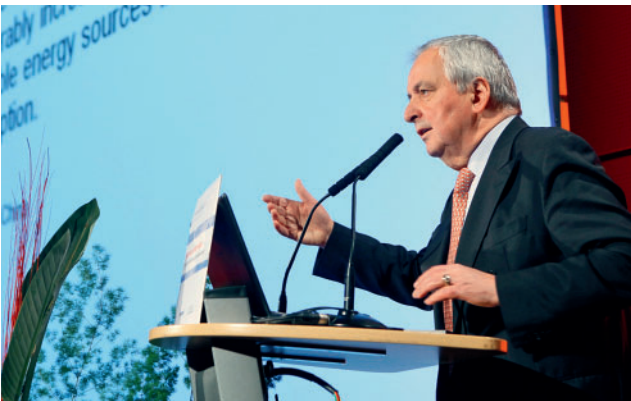
Prof. Dr. Klaus Töpfer warb für eine effizientere Ressourcennutzung.