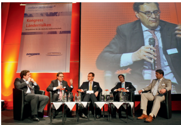
BMW-Staatssekretär Hans-Joachim Otto diskutierte im Abschlusspanel.

Eine ressourcenschonende Wirtschaftsweise sei vor allem auch zur politischen Stabilisierung der wachsenden Weltbevölkerung insbesondere in Afrika und Asien notwendig, erläuterte Prof. Dr. Klaus Töpfer, Gründungsdirektor des Institute for Advanced Sustainability Studies (IASS) in Potsdam. In seiner Rede auf dem Kongress Länderrisiken 2010 betonte er die Chancen einer Kreislaufwirtschaft, die vor allem Wasser, Rohstoffe und CO 2 wiederverwendet und die das Wort Abfall aus dem Wortschatz verbannen würde. Dies könne das Paradigma des nächsten Wachstumszyklus sein, der einer Welt mit einem Schwerpunkt junger Bewohner in Asien und Afrika Stabilität verleihen müsse.